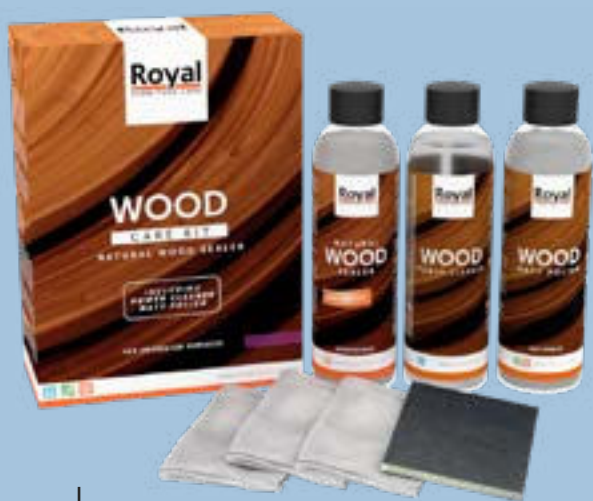
WOOD CARE KIT

Bevor Sie Ihre Holzmöbel benutzen, empfehlen wir Ihnen, einen zusätzlichen Schutz aufzutragen. Zu diesem Zweck bieten wir das Wood Care Kit an. Es enthält eine Versiegelung, einen Reiniger und eine Politur. Bevor Sie Ihre Möbel benutzen, tragen Sie die Naturholzversiegelung mit einem weichen Tuch auf. Für optimalen Schutz tragen Sie zwei Schichten auf. Lassen Sie jede Schicht 30 Minuten lang trocknen und schleifen Sie die erste Schicht mit einem Scheuerschwamm ab, bevor Sie die zweite Schicht auftragen, um optimale Ergebnisse zu erzielen.