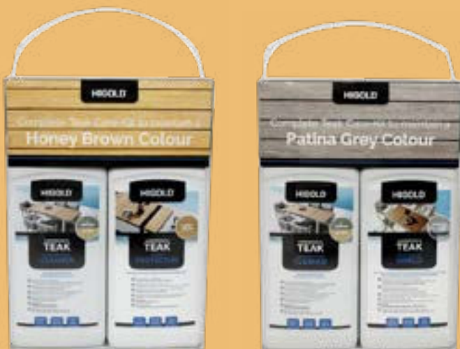
HIGOLD TEAK CARE KITS

Wenn Flecken oder Verschmutzungen auf Ihren Teakholzmöbeln auftreten, empfehlen wir die Verwendung der Teak Cleaner aus dem Higold Teak Care Kit. Tragen Sie den Teak Cleaner mit einem Tuch auf und lassen Sie ihn eine Weile einwirken. Anschließend reiben Sie den Schmutz von Ihren Möbeln ab. Achtung! Reiben Sie immer mit der Maserung des Holzes. Wenn Sie den Schmutz entfernt haben und der Reiniger eingedrungen ist, können Sie mit dem Teak Protector eine neue Schutzschicht auftragen, so dass Ihre Möbel wieder optimal geschützt sind. Wiederholen Sie diese Behandlung 2 bis 4 Mal pro Jahr für einen optimalen Schutz.