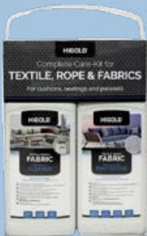
HIGOLD TEXTILE ROPE & FABRICS CARE KIT

Bevor Sie Ihre Möbel benutzen, können Sie eine zusätzliche Schutzschicht mit dem Protector aus dem Higold Textile, Rope & Fabrics Care Kit auftragen. Dieser bildet eine Schutzschicht auf Ihren Polstern und sorgt dafür, dass diese in einem Top-Zustand bleiben. Der Protector wird in einer Sprühdose geliefert und kann mit dieser auf die Polsterung aufgetragen werden. Sprühen Sie den Protector in gleichmäßigen Streifen auf den Stoff.