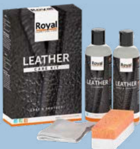
LEATHER CARE KIT

Bevor Sie Ihre Möbel benutzen, können Sie mit Care & Protect aus dem Leather Care Kit eine zusätzliche Schutzschicht auf das Leder auftragen. So entsteht eine Schutzschicht und Ihr Leder bleibt in bestem Zustand. Tragen Sie den Care & Protect auf ein fusselfreies Tuch auf und verreiben Sie die Ledercreme gleichmäßig auf der Oberfläche. Lassen Sie es 15 Minuten lang trocknen und reiben Sie es dann mit einem sauberen Tuch ab.