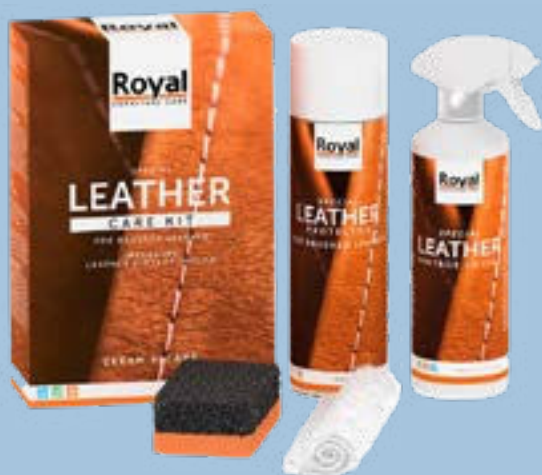
BRUSHED LEATHER CARE KIT

Bevor Sie Ihre Möbel benutzen, tragen Sie eine zusätzliche Schutzschicht auf das Leder auf, und zwar mit dem Leather Protector aus unserem Brushed Leather Care Kit. So entsteht eine Schutzschicht und Ihr Leder bleibt in bestem Zustand. Sprühen Sie den Leather Protector in gleichmäßigen Streifen in einem Abstand von etwa 20-30 cm auf das Leder. Lassen Sie ihn dann 12 Stunden lang trocknen.