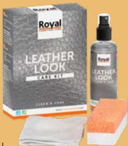
LEATHER LOOK CARE KIT

Bevor Sie Ihre Möbel benutzen, können Sie mit dem Care & Protect aus unserem Leather Look Care Kit eine zusätzliche Schutzschicht auf das Kunstleder auftragen. Dadurch entsteht eine Schutzschicht auf Ihrem Kunstleder und Ihr Kunstleder bleibt in einem Top-Zustand. Sprühen Sie das Care & Protect in einem Abstand von ca. 20-30 cm in gleichmäßigen Streifen auf das Kunstleder. Lassen Sie es anschließend 12 Stunden lang trocknen.